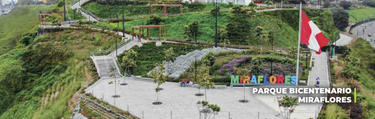
PARQUE BICENTENARIO MIRAFLORES