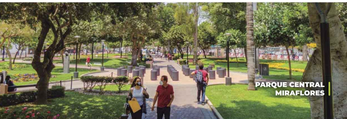
PARQUE CENTRAL MIRAFLORES